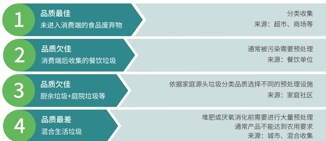
图3 厨余垃圾来源及品质

图3总结了不同来源的易腐有机垃圾及其品质，原料品质主要取决于垃圾源类型和分类收集程序。原料品质也决定了后续有机垃圾处理技术的选择以及产品的使用场景。其中超市商场等商业源较容易实现对于厨余垃圾的分类收集（类型1），